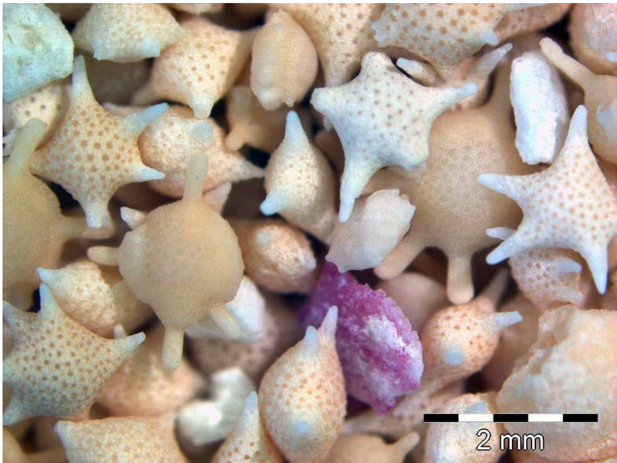
Sand aus Japan (Japan Star)

Fast 5.000 verschiedene Sandproben aus 243 Ländern finden sich in meiner Sandsammlung. Von der Copacabana über Nauru, vom Mount Everest bis hin zum 2.400 Meter tiefen Tiefseeberg McDonald im Südpazifik. Ich bin fasziniert von den Korngrößen und -formen, den verschiedenen Farben, der unzähligen Mineralien und Gesteinen. Manchmal finden sich auch Muschel- oder Korallenbruchstücke und einzellige Lebewesen, sogenannte Foraminiferen, im Sand. Jede Sandprobe hat auch eine Geschichte für mich, darüber wer sie gesammelt hat und wann und wie sie gesammelt wurden. Das macht jede Sandprobe einzigartig! Die meisten Sandproben meiner Sandsammlung stammen von Stränden, es gibt aber auch viele Sandproben von Flüssen, Seen, Höhlen, Gebirgen, Wüsten, Dünen, aus der Tiefsee und sogar von Ausgrabungen für U-Bahnstationen.