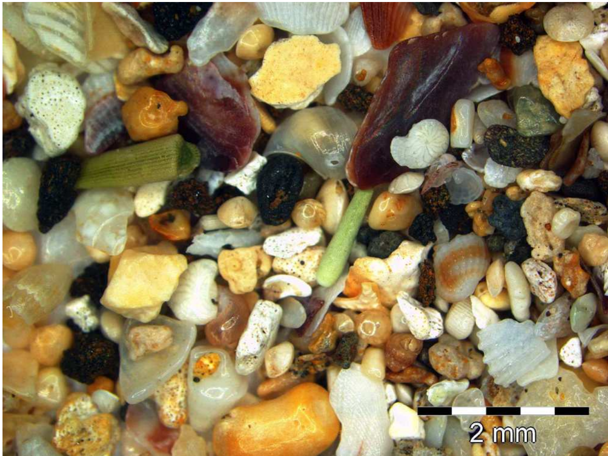
Sand von Kealia, Hawaii

Endlich angekommen machte ich Rast am Pachena Beach im Pacific-Rim-Nationalpark. Hier blieb ich lange am Sandstrand sitzen und blickte über den Nordpazifik. Bevor ich mir einen Zeltplatz suchte, nahm ich eine Handvoll Sand vom Pachena Beach mit, da mir der Schreck durch die Begegnung mit dem Bären noch immer in den Gliedern saß. Ich weiß bis heute nicht, ob es nur ein Reflex war oder der Wunsch, diese Bärenbegegnung durch etwas »Greifbares« zu kompensieren. Jedenfalls war dies meine erste Sandprobe. Sie stand einige Jahre auf meinem Schreibtisch in einer Glasflasche und brachte mich seitdem immer wieder zum Fernwehträumen.