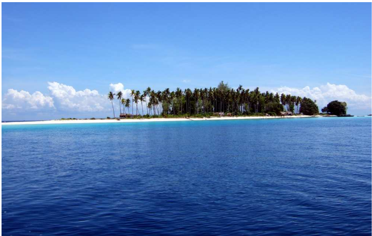
Die Insel Sipadan

Es war der Nationalfeiertag Canada Day am 1. Juli 1996, ich befand mich auf Vancouver Island in Kanada. Zwei Wochen war ich mit meinem voll gepackten Fahrrad bereits auf Tour. Ich radelte auf einer Piste, die sich durch die Wildnis von Vancouver Island schlängelte. Keine menschliche Siedlung weit und breit, kein Auto kam mir entgegen. Wildnis pur! Plötzlich bemerkte ich ein Rascheln im Gebüsch, etwa 30 Meter vor mir. Ich hielt an und wartete. Nichts tat sich. Als ich gerade einen Schluck Wasser trinken wollte, blieb ich wie erstarrt stehen. Tapsig überquerte ein kleiner Braunbär den Weg. Aber wo war die Mutter? Noch lange blieb ich stehen, mein Puls raste. Ich drehte mich nach allen Seiten um, nichts zu hören, nichts tat sich. Vielleicht war die Mutter schon weg. Langsam stieg ich wieder auf mein Fahrrad und radelte mit Dauerklingeln die restlichen 40 Kilometer bis Bamfield, an der Westküste, weiter und hoffte alle Bären rechtzeitig vor mir zu warnen.