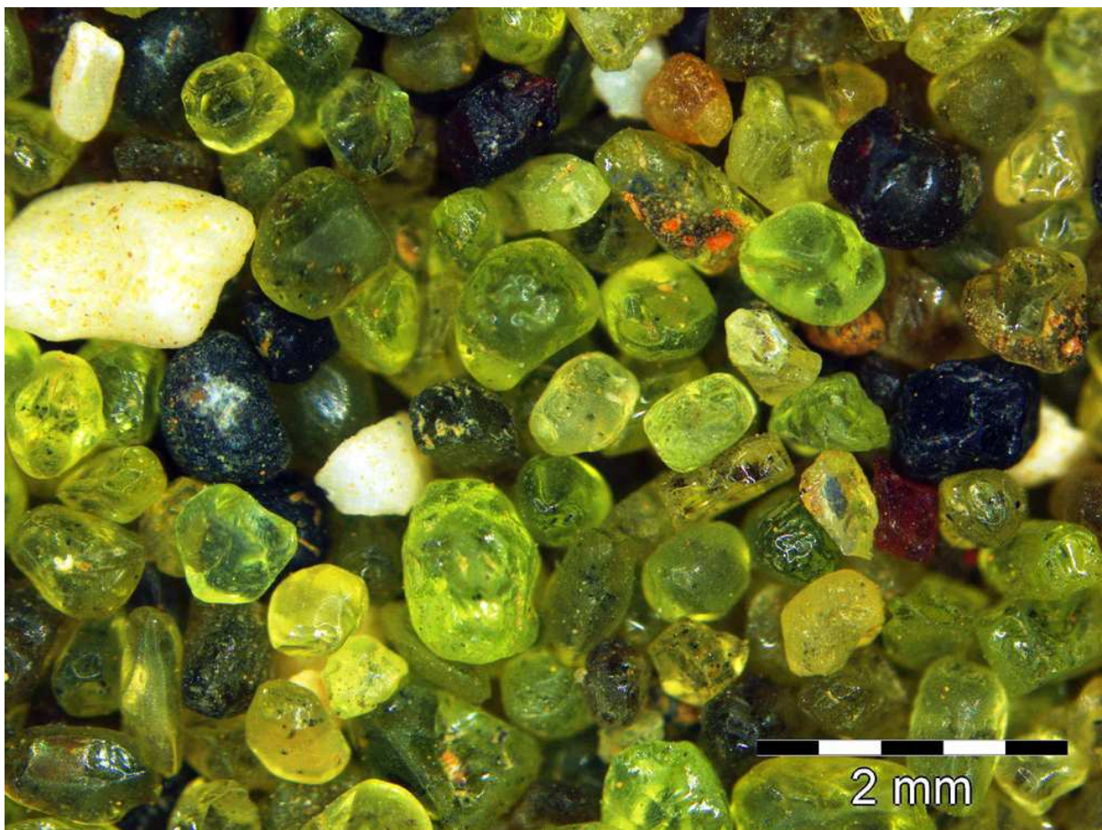
Sand von der Papakolea Beach (Green Sand Beach), Hawaii

Es sind also auch die kleinen Geschichten, die die Sandproben für mich interessant machen. Zudem haben mir Freunde und Bekannte von ihren Reisen viele verschiedene Sandproben mitgebracht und meine Sandsammelleidenschaft wurde intensiver. Ich nahm Kontakt auf zu anderen Sandsammlern und merkte schnell, dass ich als Sandsammler nicht allein war.